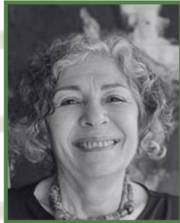
Jal a Makhzoumi Líbano